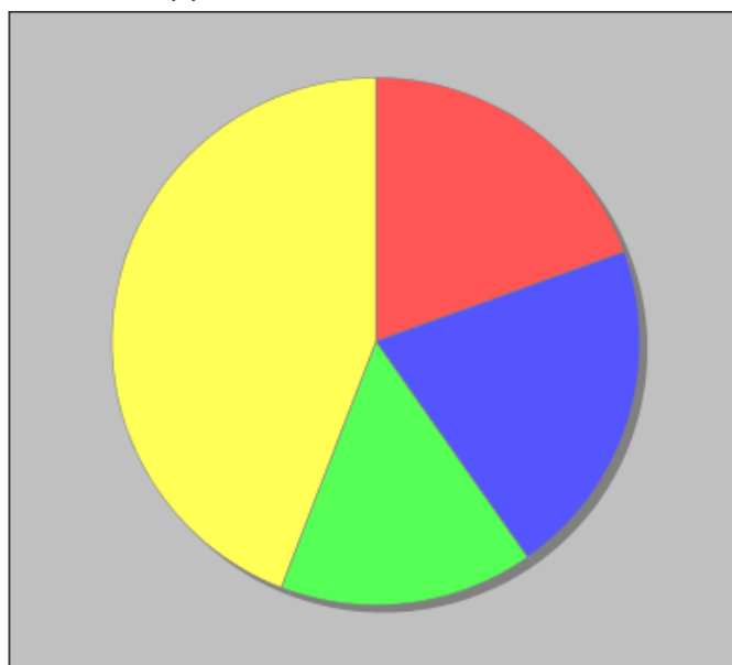
Distribuzione dei docenti a T.I. per anzianità nel ruolo di appartenenza (riferita all'ultimo ruolo)